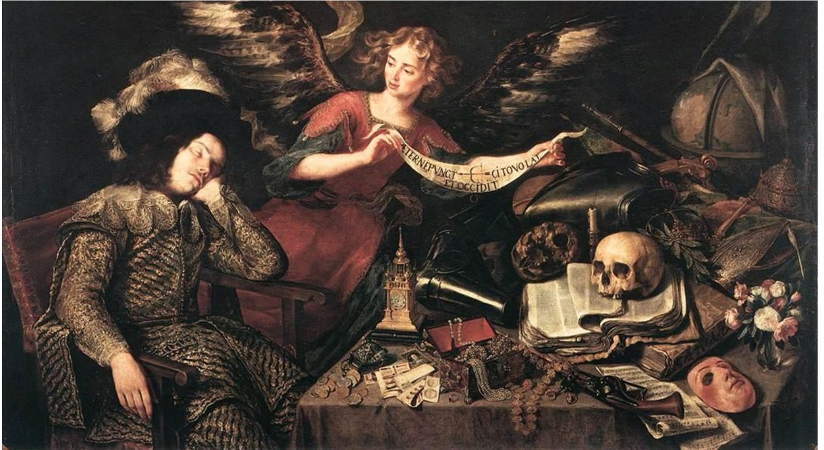
The Knight's Dream de Antonio de Pereda