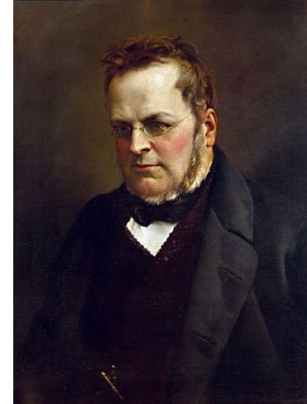
Camilo Benso, conde de Cavour