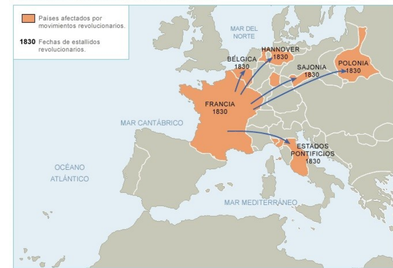
Los movimientos revolucionarios de 1830 imprimir