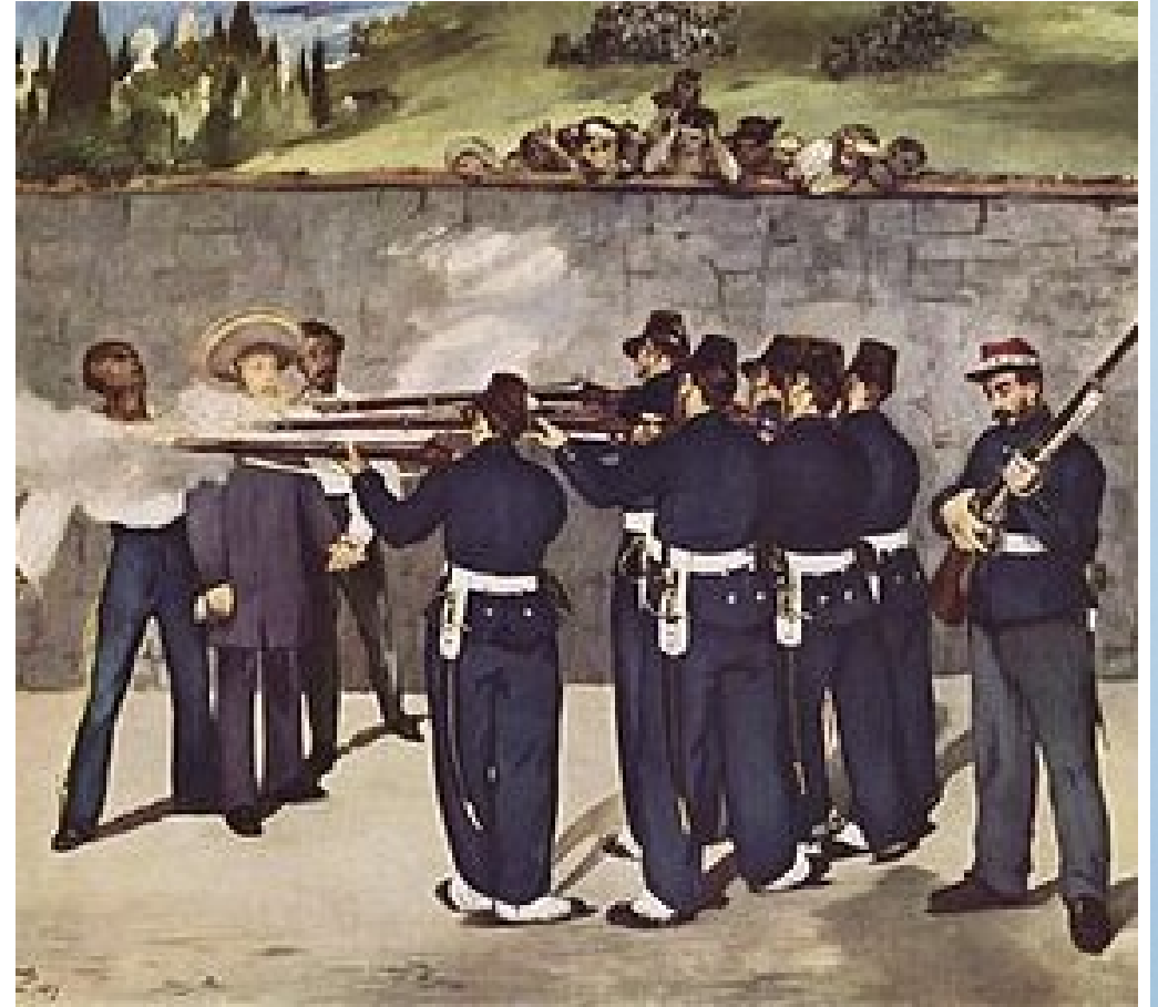
L'Exécution de Maximilien- E.Manet 1867

https://www.youtube.com/watch?v=6ARLYrbXWbs Eugenia de Montijo.