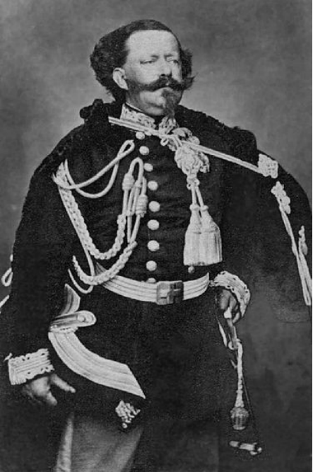
Víctor Manuel II