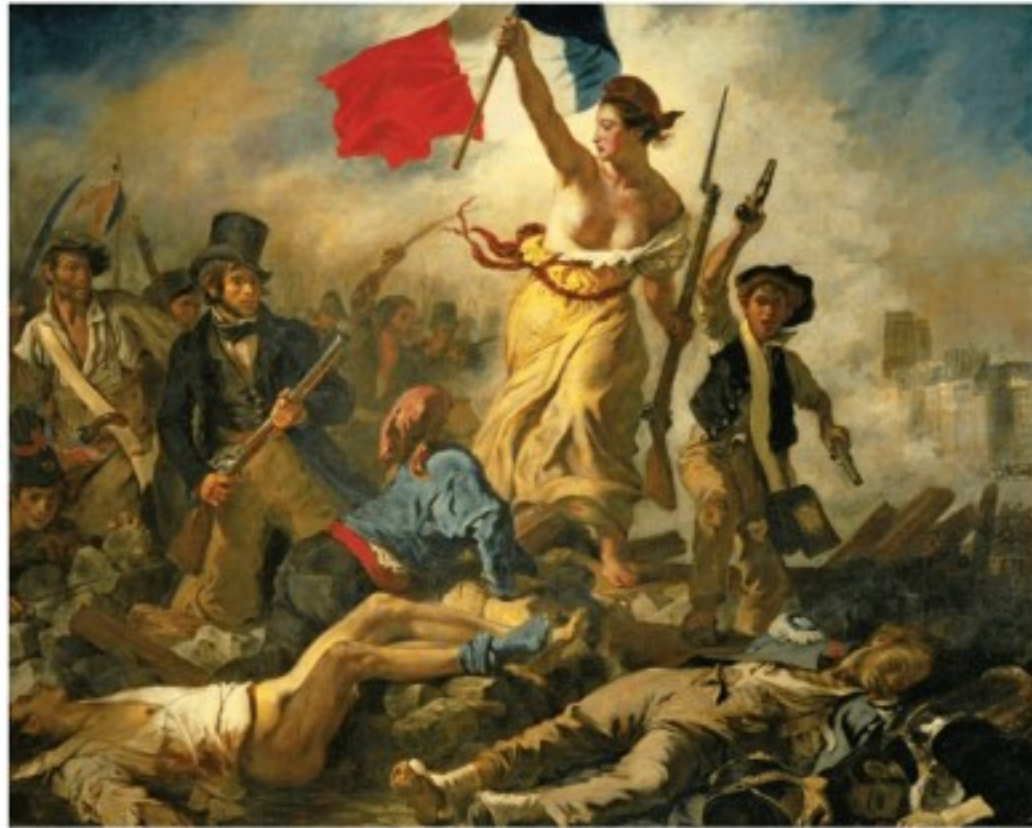
E. DELACROIX, La libertad guiando al pueblo, 1830. Esta pintura romántica es un homenaje a los revolucionarios de 1830 que exalta los principios liberales frente al absolutismo.