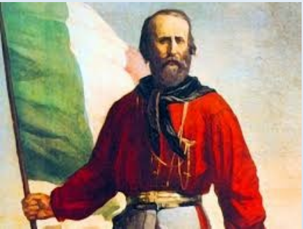
Giuseppe Garibaldi- Camisas rojas

-Tras esto se convocó un nuevo parlamento que proclamó a Víctor Manuel II, rey de Italia en 1861.